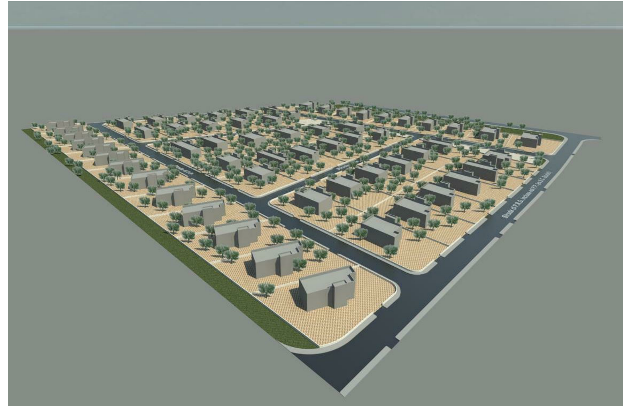
Rendering lato sud Scale 1:1