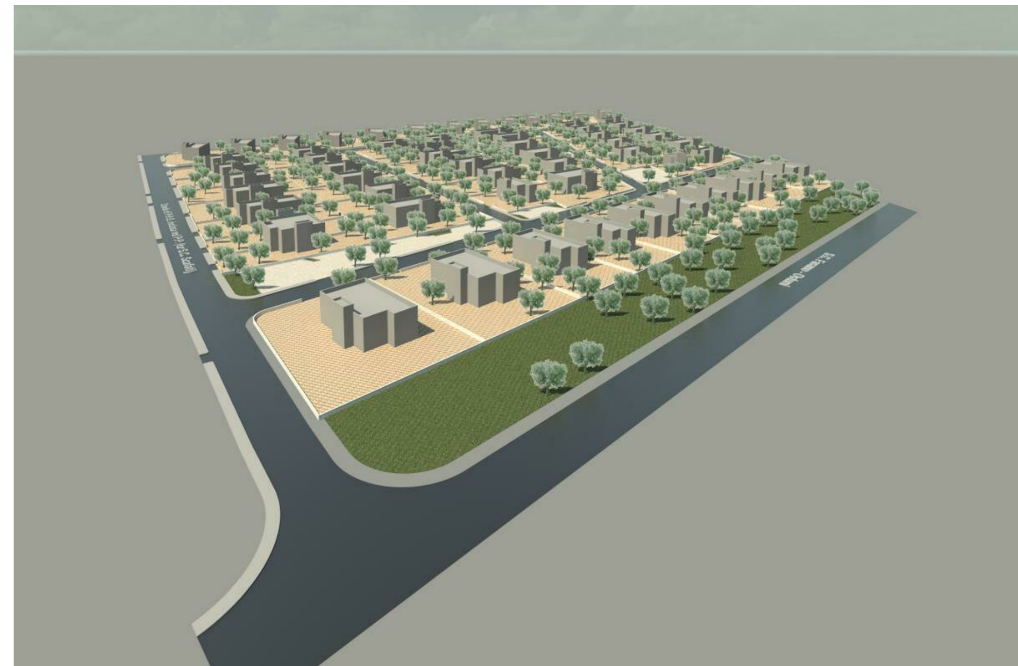
Rendering lato ovest Scale 1:1