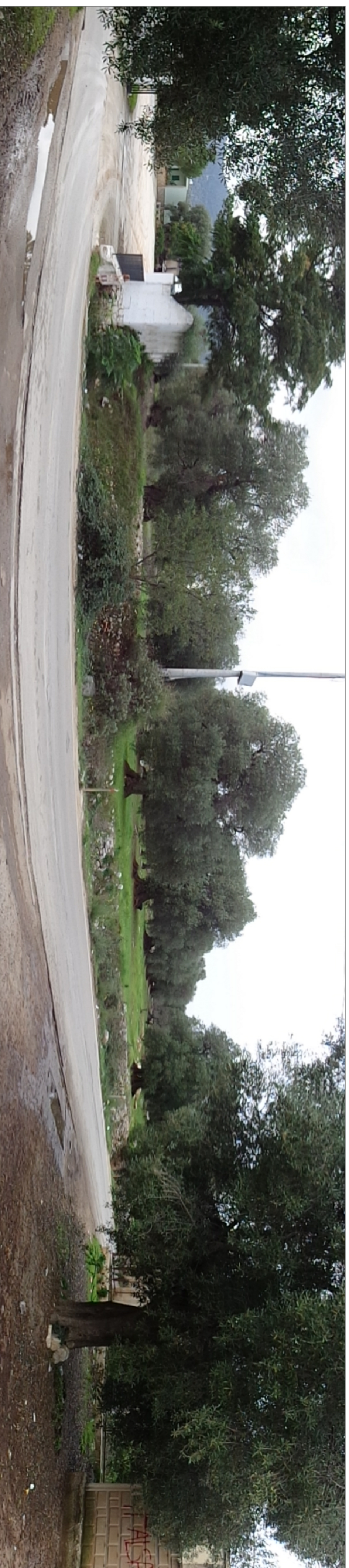
Foto n. 2 (vista da via Gravinella - strada rettilinea - deformazione dovuta alla foto di tipo panoramico)