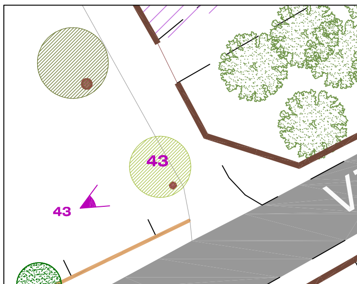
Punto di presa fotografica