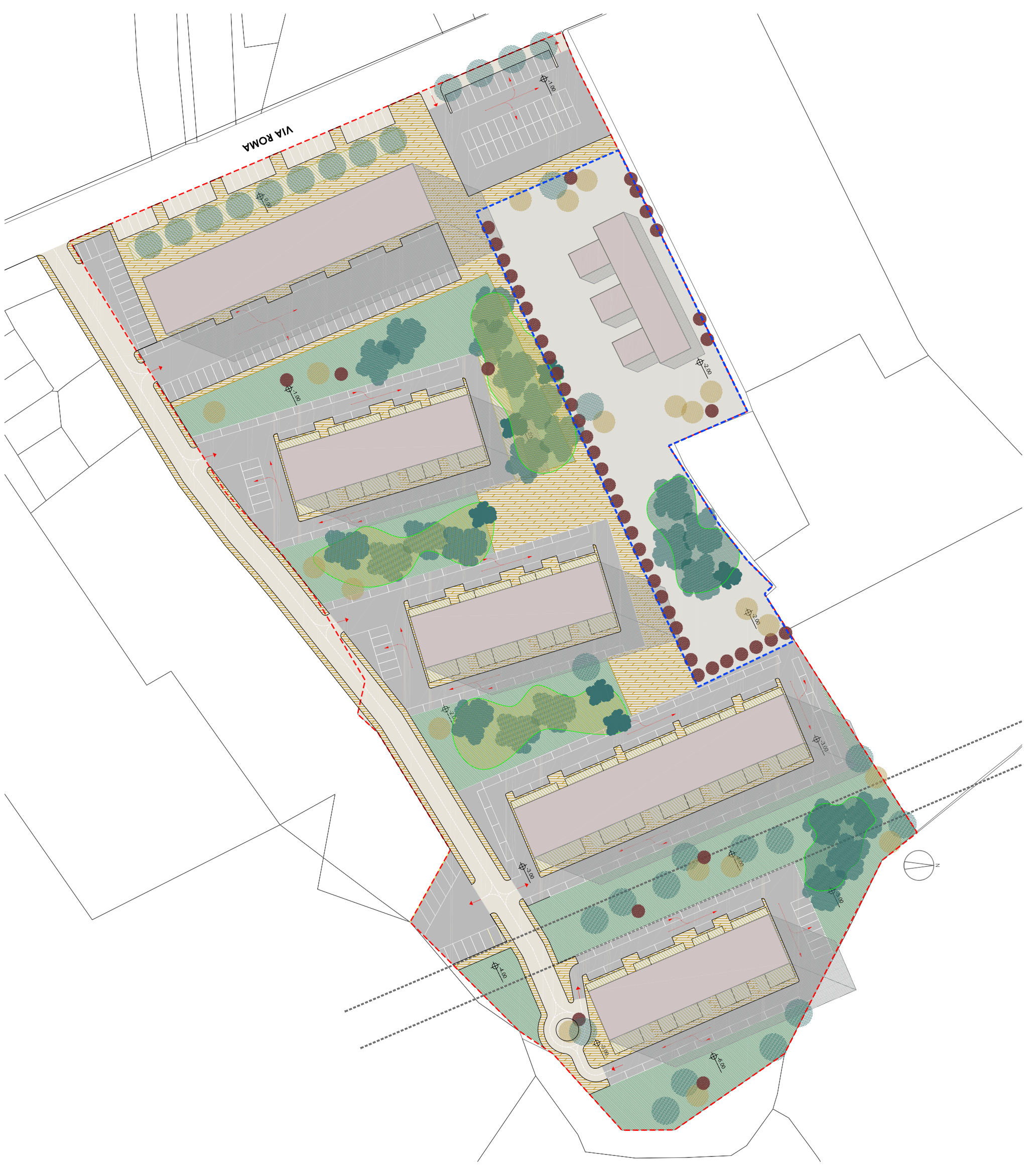
PLANIVOLUMETRICO ESEMPLIFICATIVO scala 1:1.000