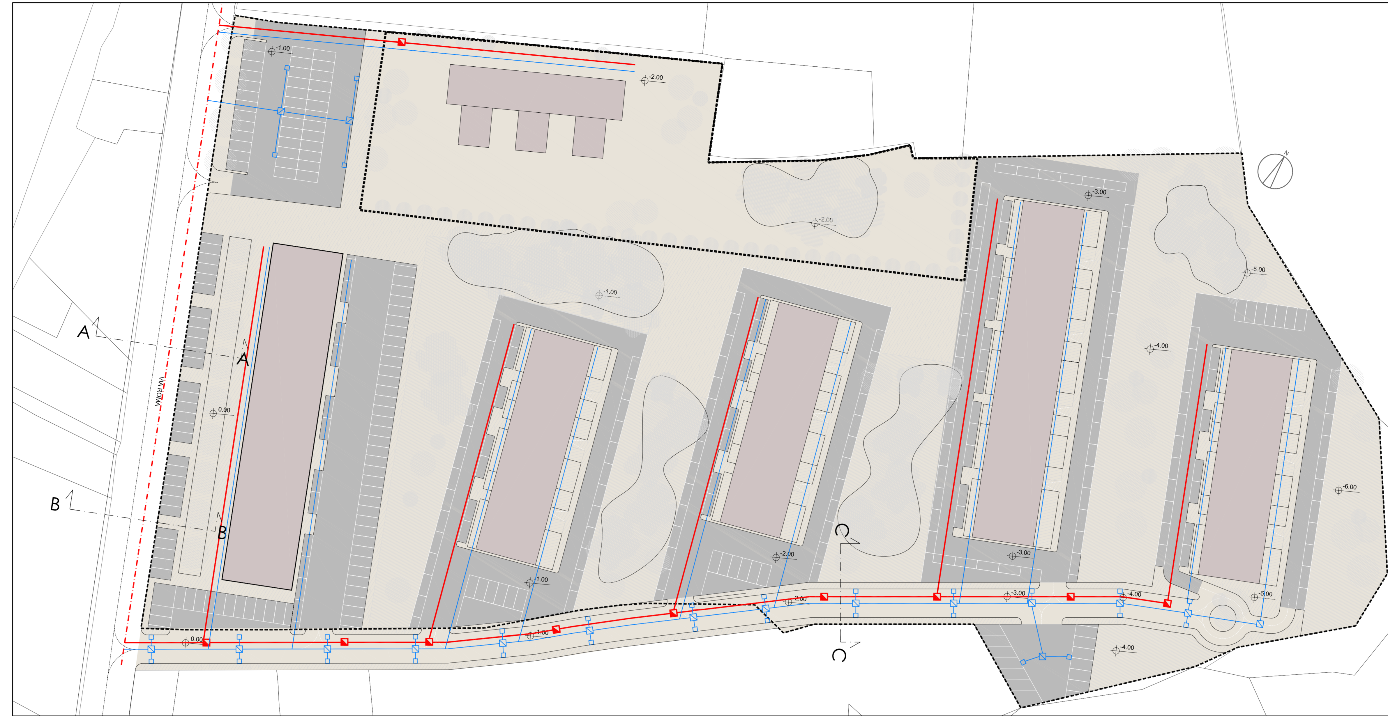
OPERE DI URBANIZZAZIONE PRIMARIA - rete acque bianche e rete acque nere - scala 1:500