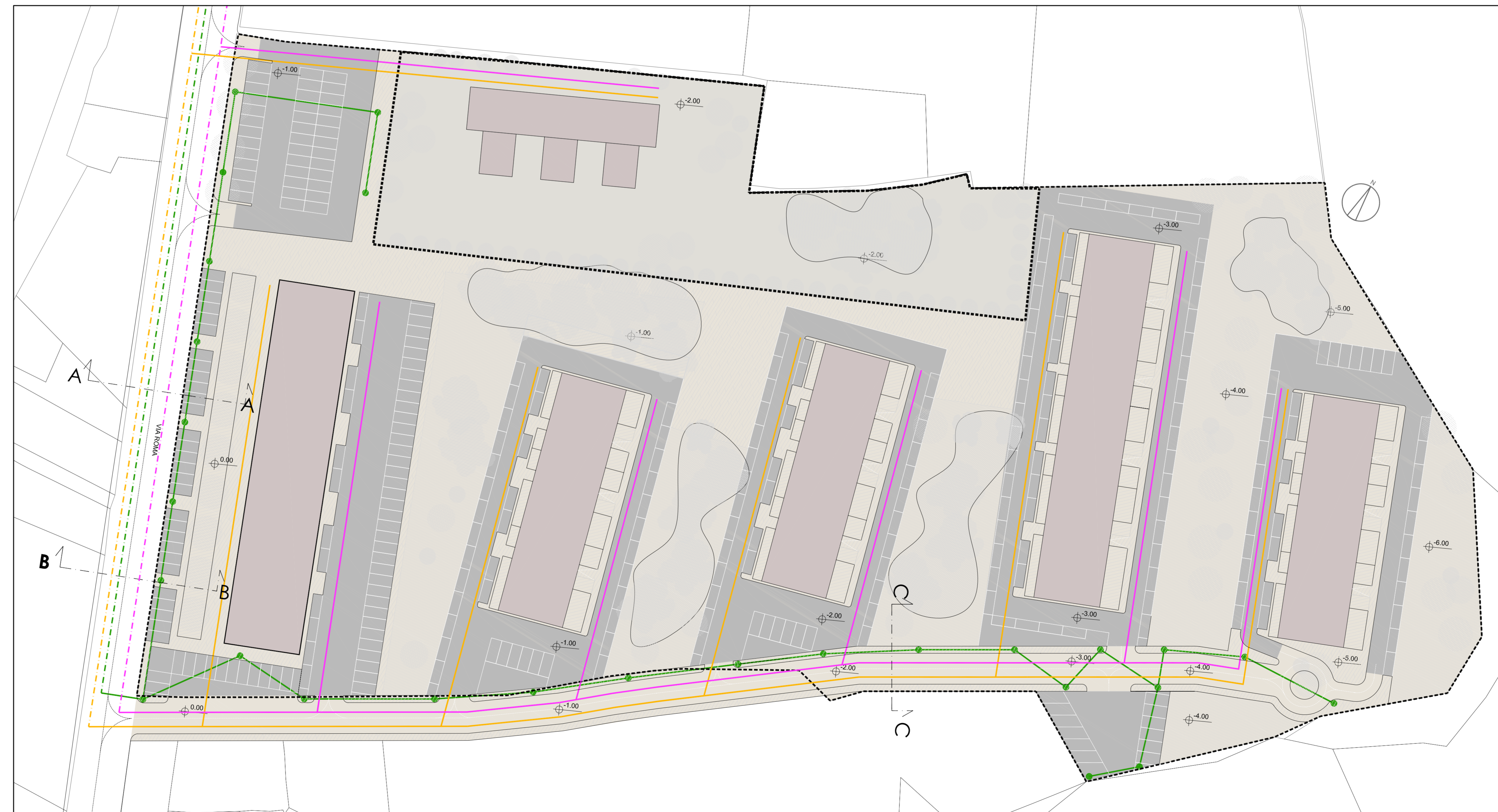
OPERE DI URBANIZZAZIONE PRIMARIA - rete illuminazione pubblica, rete idrica e rete gas - scala 1:500